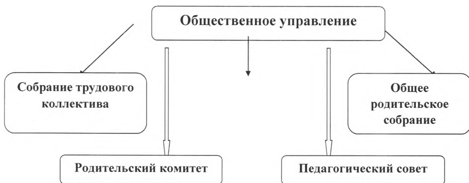
Схема общественного управления

Управление Детским садом строится на принципах единоначалия и коллегиальности. Коллегиальными органами управления являются: управляющий совет, педагогический совет, общее собрание работников. Единоличным исполнительным органом является руководитель – заведующий.